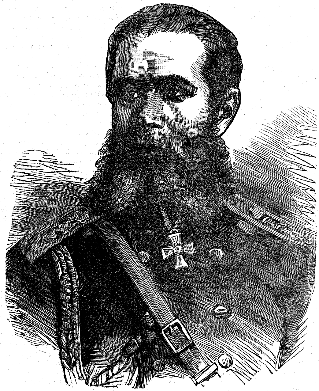
Ο ΣΤΡΑΤΗΓΟΣ ΓΟΥΡΚΟΣ [Ἰδὲ σελ. ὀπισθεν]

μεθ' ἐν τῷ φρουρίῳ τούτῳ, ὡς θυγατέρα μου· ὁ δὲ σύζυγός μου δὲν θέλει ἐναντιωθῆ εἰς τὴν ἀπόφασίν μου ταύτην.» Ἡ Ρόζα ἐφαίνετο λίαν συγκεχυμένη· ἀπορούσα δὲ τί νὰ ἀπαντήσῃ, ἔμεινε σιωπηλή. Τὸ νὰ παρητηθῇ τῆς ὑπηρεσίας τοῦ θυρωροῦ οὔτε νὰ συλλογισθῇ ἠδύνατο· διότι τοῦτο ἤθελεν ὅχι μόνον τὴν